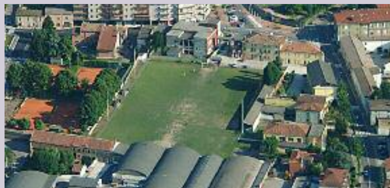
Stadio Comunale Fratelli Sommariva - Cerea si prepara all'ultimo saluto a cui parteciperanno volti noti del calcio italiano

Eraldi Pecci, Ciccio Graziani, Claudio e Patrizio Sala ed altri ancora scenderanno in campo per sfidare i calciatori che hanno militato in questi anni tra le file dell'U.S. Cerea.