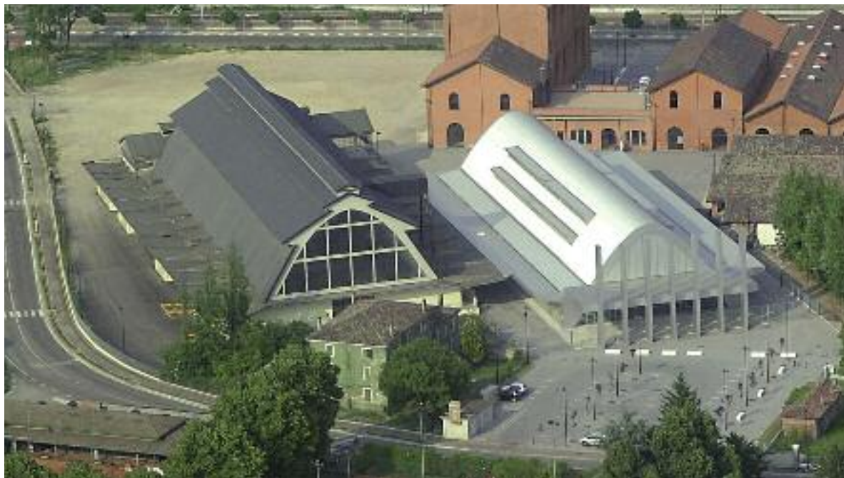
L'Area Ex Perfosfati - L'amministrazione considera il polo fieristico una struttura fondamentale per promuovere l'economia del territorio.