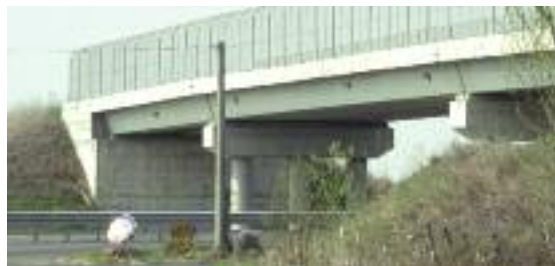
Snodo nevralgico - Il cavalcavia "dei veleni" di via Motta sarà presto completato grazie al pressing costante dell'amministrazione Marconcini sui soggetti interessati.

Tra le indicazioni - di cui si chiede l'inserimento nel progetto definitivo - l'aumento dei piezometri utilizzati per il monitoraggio, il prolungamento, rispetto ai cinque anni previsti, dei tempi indicati per il controllo delle acque, ed il posizionamento di una precisa tipologia di guard-rail sulle rampe di accesso al cavalcavia. «Considero questo incontro un passo in avanti molto significativo - ha specificato il sindaco - perché è arrivata la conferma che stiamo procedendo nella direzione giusta».